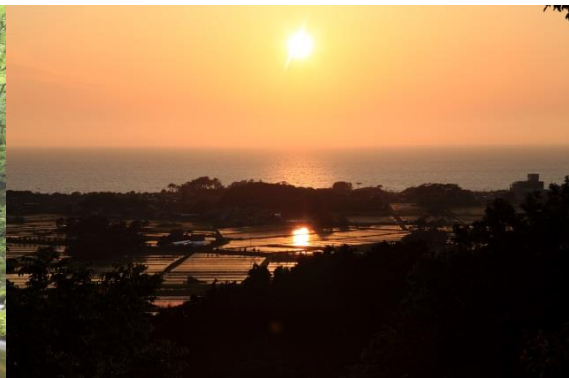
【日本海に沈む夕日】