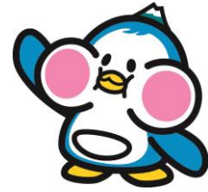
にかほ市マスコット「にかほっぺん」