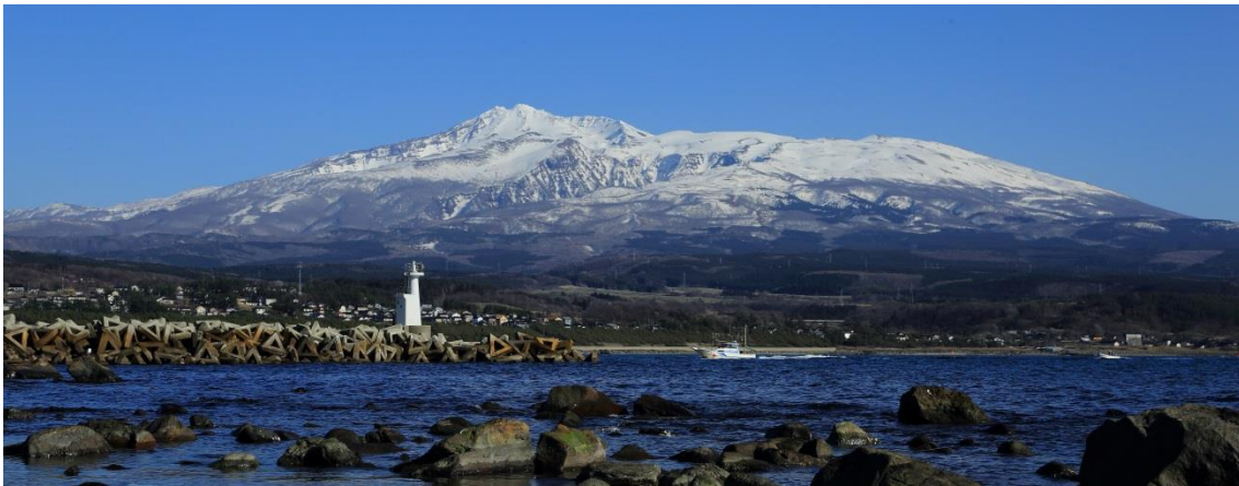
【日本海から望む鳥海山】

本市が移住・Uターン先として選ばれる地域づくりを進めるため、都市圏に居住する方の新たな視点や発想でこれらの豊富な魅力を首都圏等に情報発信し、移住に関するイベントの企画立案・実施等を通して、移住希望者とにかほ市との橋渡し（リエゾン）となる人材を募集します。