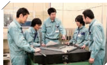
コミュニケーションは良い製品の第一歩