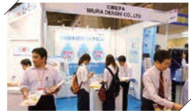
東京ビッグサイト(営業)