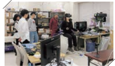
大学や研究機関との共同研究