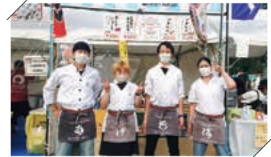
ご当地グルメ活動