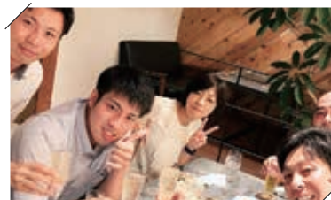
月末慰労会！（※写真は2019年に撮影したものです）