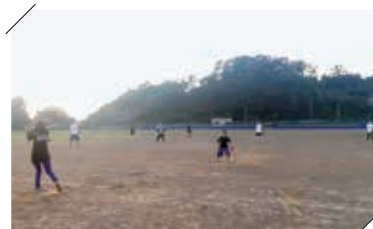
天気のいい日は一緒にスポーツ！