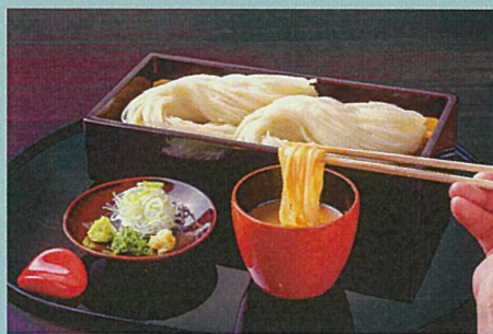
稲庭うどんみそたれ