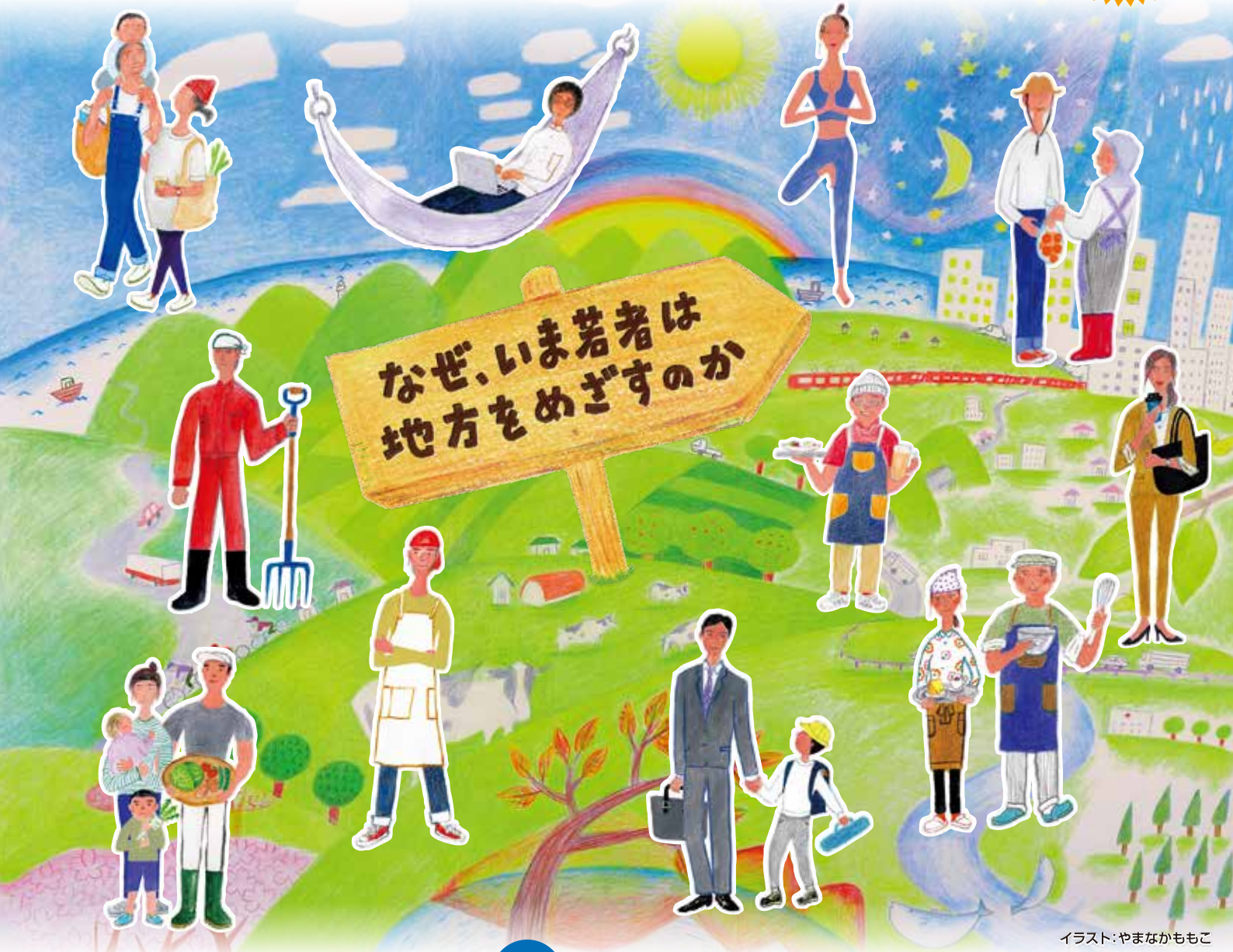
イラスト:やまなかももこ