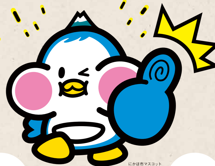
にかほ市マスコット にかほっぺん